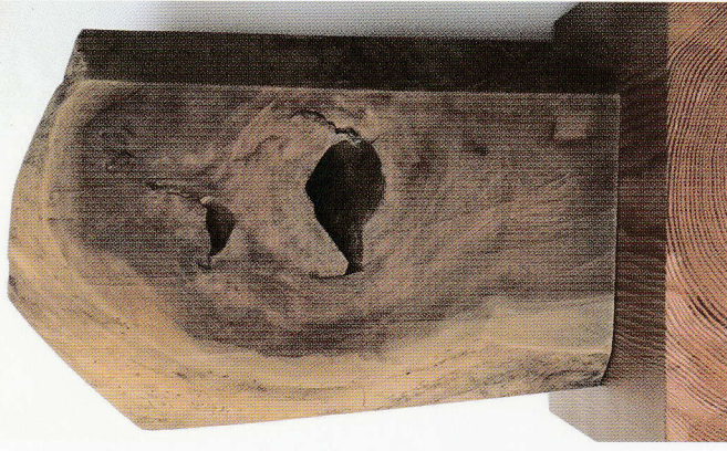
絶望の叫び けやき H166.5cm