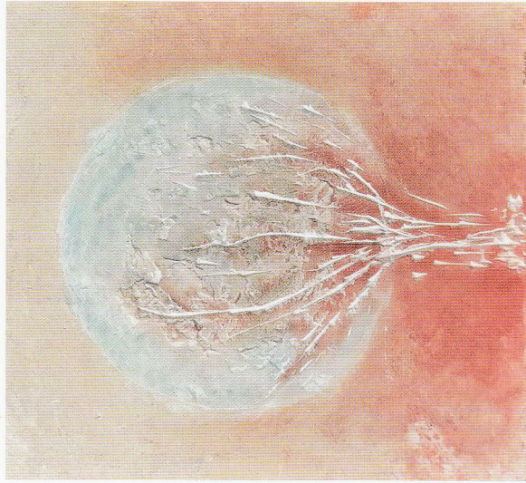
遺跡に咲く花 石膏 キャンパス 62×55cm